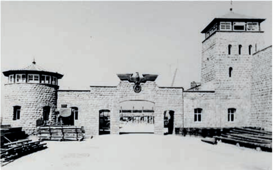
Ingresso delle SS del campo di concentramento di Mauthausen, Austria. Foto di Paul Ricken, 1942, credito USHMM

Al termine del seminario di formazione un gruppo di circa 50 studenti e studentesse degli Istituti superiori riminesi parteciperà ad un viaggio studio della durata di 4 giorni in Austria, con visite agli ex campi di concentramento nazisti di Mauthausen e di Gusen, e al centro di sterminio col gas di Hartheim. Obiettivi del viaggio saranno principalmente tre: a) approfondire la storia del nazismo e della creazione e sviluppo di un sistema di campi di concentramento con una