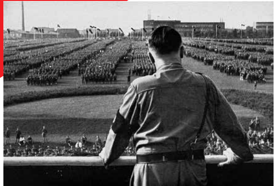
Hitler tiene un discorso ai membri delle S.A. a Dortmund, Germania, 1933