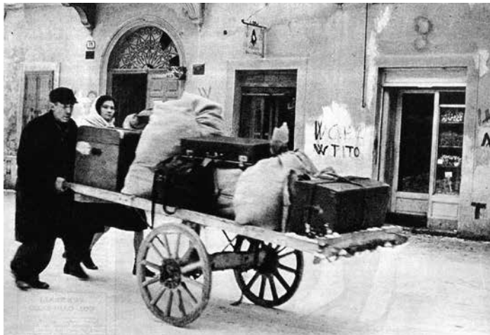
L'esodo da Pola. Si portano via le masserizie.

jugoslava (slovena e croata) – suscitando così incomprensioni e deformazioni interpretative. Infatti, è solo applicando contemporaneamente punti di vista diversi, che si può sperare di comprendere le dinamiche di un territorio plurale, che nel corso del '900 oscillò fra diverse appartenenze statuali. Inoltre, le versioni offerte dalle singole storiografie nazionali non fanno che rafforzare le memorie divise già a suo tempo generate dai fatti e capaci di travalicare le generazioni. Può essere utile allora tentare, almeno per grandi linee, un approccio globale, che tenga conto sia dei fili di continuità che dei momenti di rottura: nei contesti, nei soggetti storici e nelle culture della violenza. La ricognizione, necessariamente sintetica e problematica, partirà dai precedenti in epoca asburgica per spingersi fino alla prima delle stragi