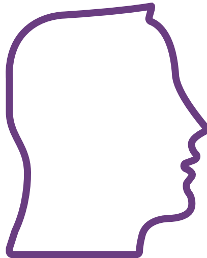
Il cittadino del quartiere