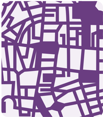
La mappa del quartiere (il pattern)

Il volto, simbolo dell'individualità, si fonde con la mappa, rappresentazione del territorio, suggerendo un legame indissolubile tra cittadino e quartiere.