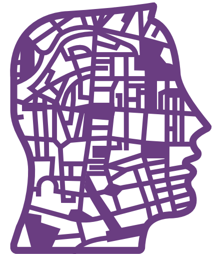
La cittadinanza attiva