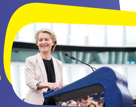
Ursula von der Leyen Presidente della Commissione europea

A partire dal 2025, la nuova rete comune di consiglieri locali dell'UE sarà pienamente operativa. I membri riceveranno una serie di prodotti rinnovati, contrassegnati da una nuova identità visiva, compresa una nuova newsletter, e allo stesso tempo manterranno l'accesso privilegiato ai principali prodotti e servizi dell'UE, al sito web, ecc.