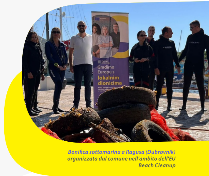
Bonifica sottomarina a Ragusa (Dubrovnik) organizzata dal comune nell'ambito dell'EU Beach Cleanup

Il 21 settembre, nel quadro dell'iniziativa EU Beach Cleanup , il sindaco Mato Franković ha celebrato la Giornata mondiale del risanamento subacqueo a Malfi (Zaton), durante la quale è stata rimossa oltre mezza tonnellata di rifiuti dal fondale marino. Sostenuto da una lettera di intenti firmata dal sindaco, l'evento ha messo in evidenza gli sforzi compiuti da Ragusa (Dubrovnik) per mantenere un ambiente marino più pulito e ha dimostrato un impegno efficace della comunità nella protezione dell'ambiente.