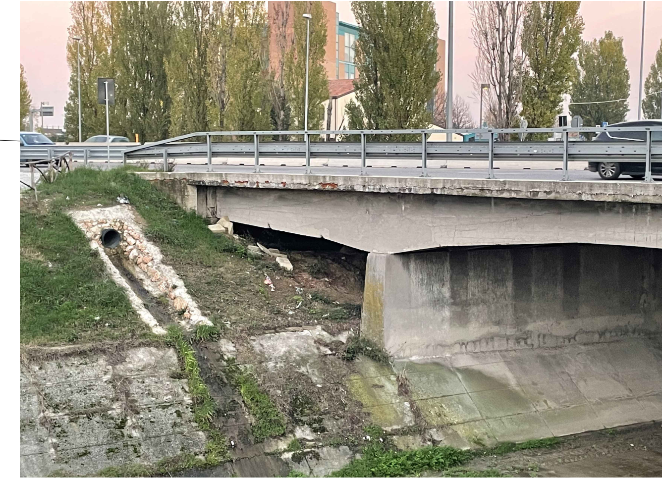
Vista lato monte