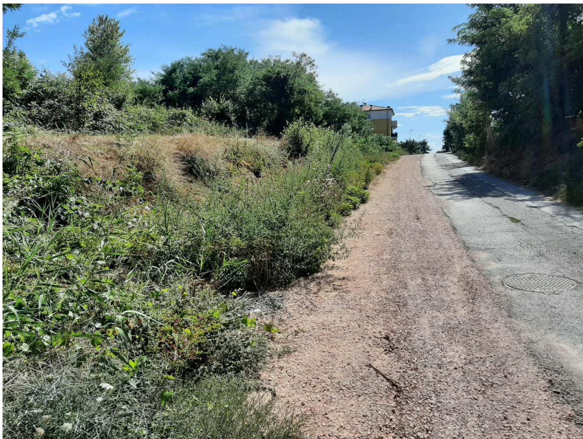
Direzione mare – monte – Foto 3 in prossimità della sezione 10 individuata sull'elaborato grafico TAV. N.3