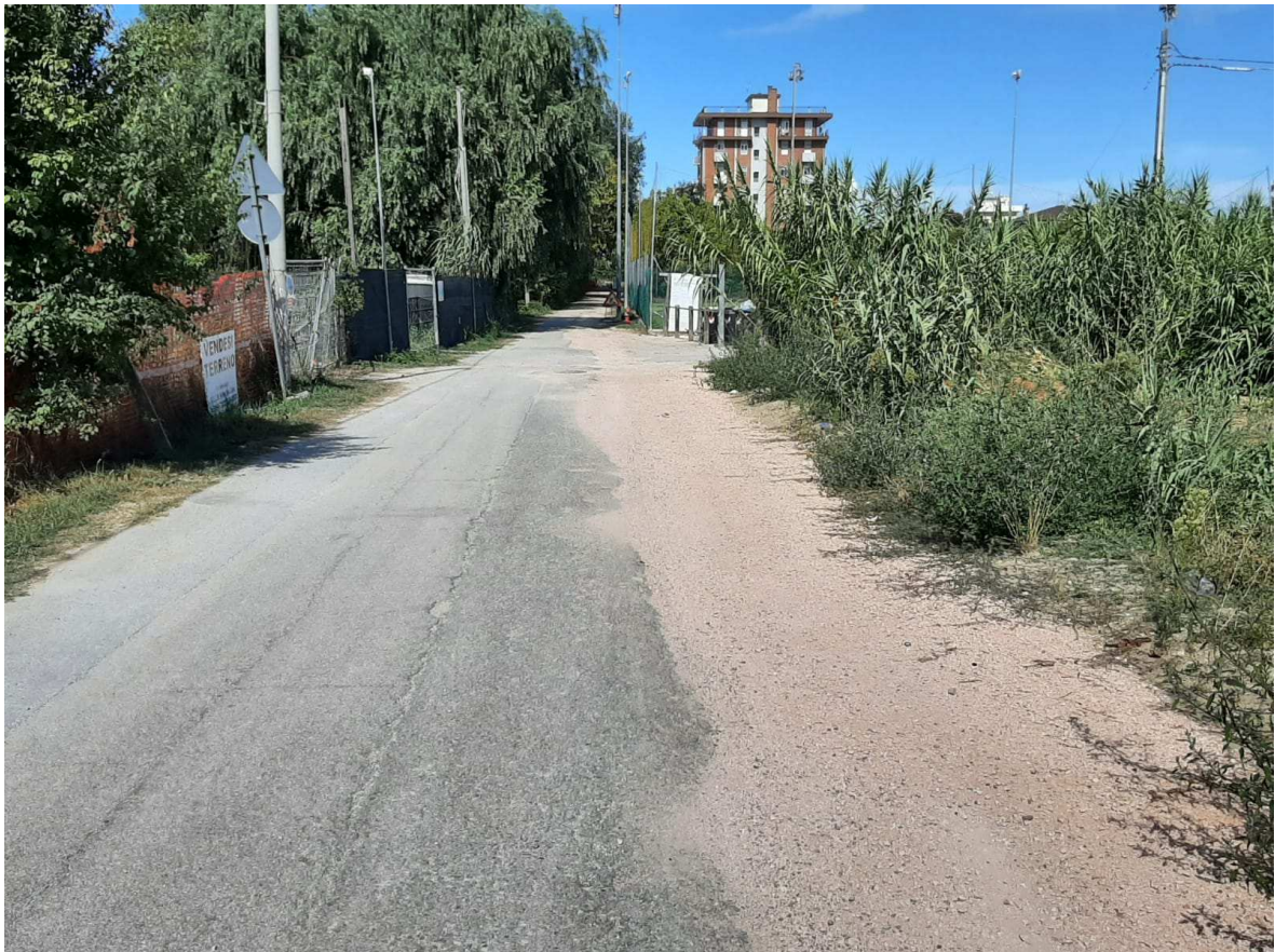
Direzione monte – mare – Foto 8 in prossimità della sezione 15 individuata sull'elaborato grafico TAV. N.3