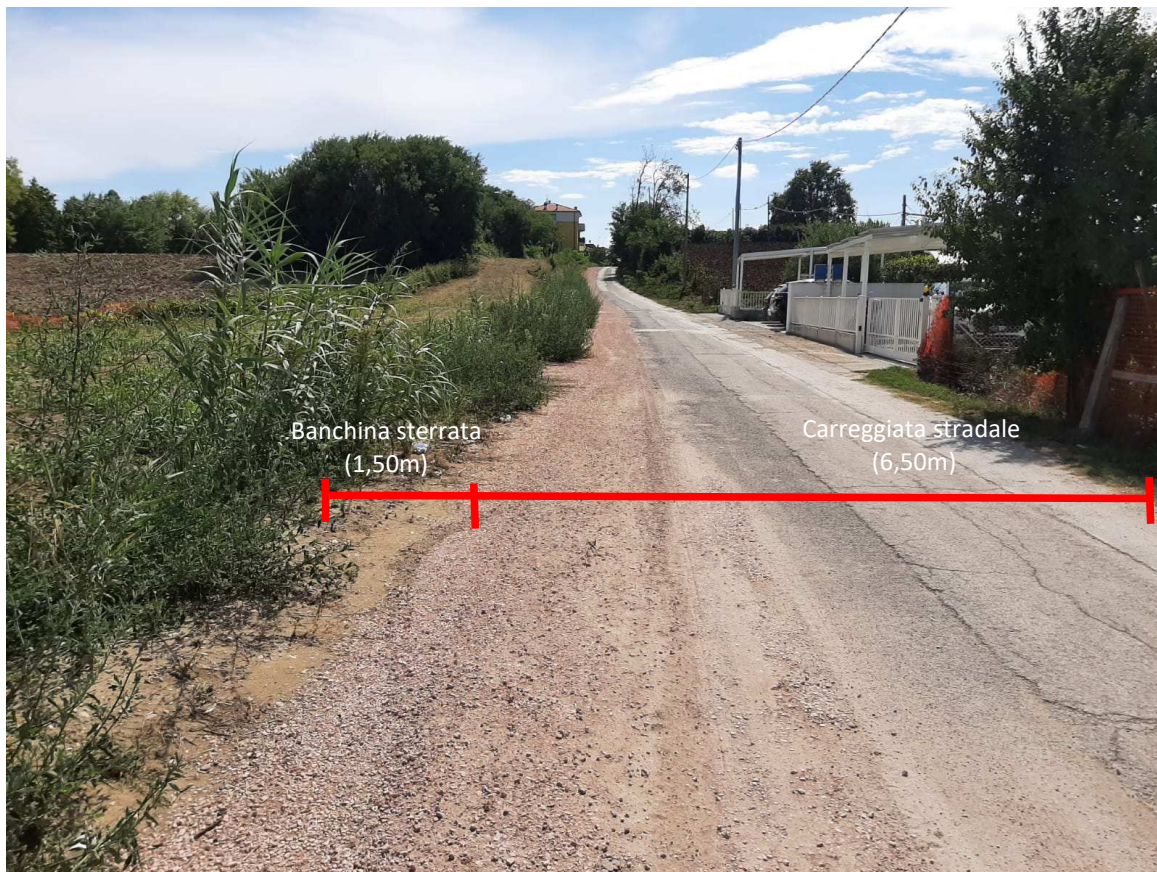
Direzione mare – monte – Foto 1 in prossimità della sezione 15 individuata sull'elaborato grafico TAV. N.3