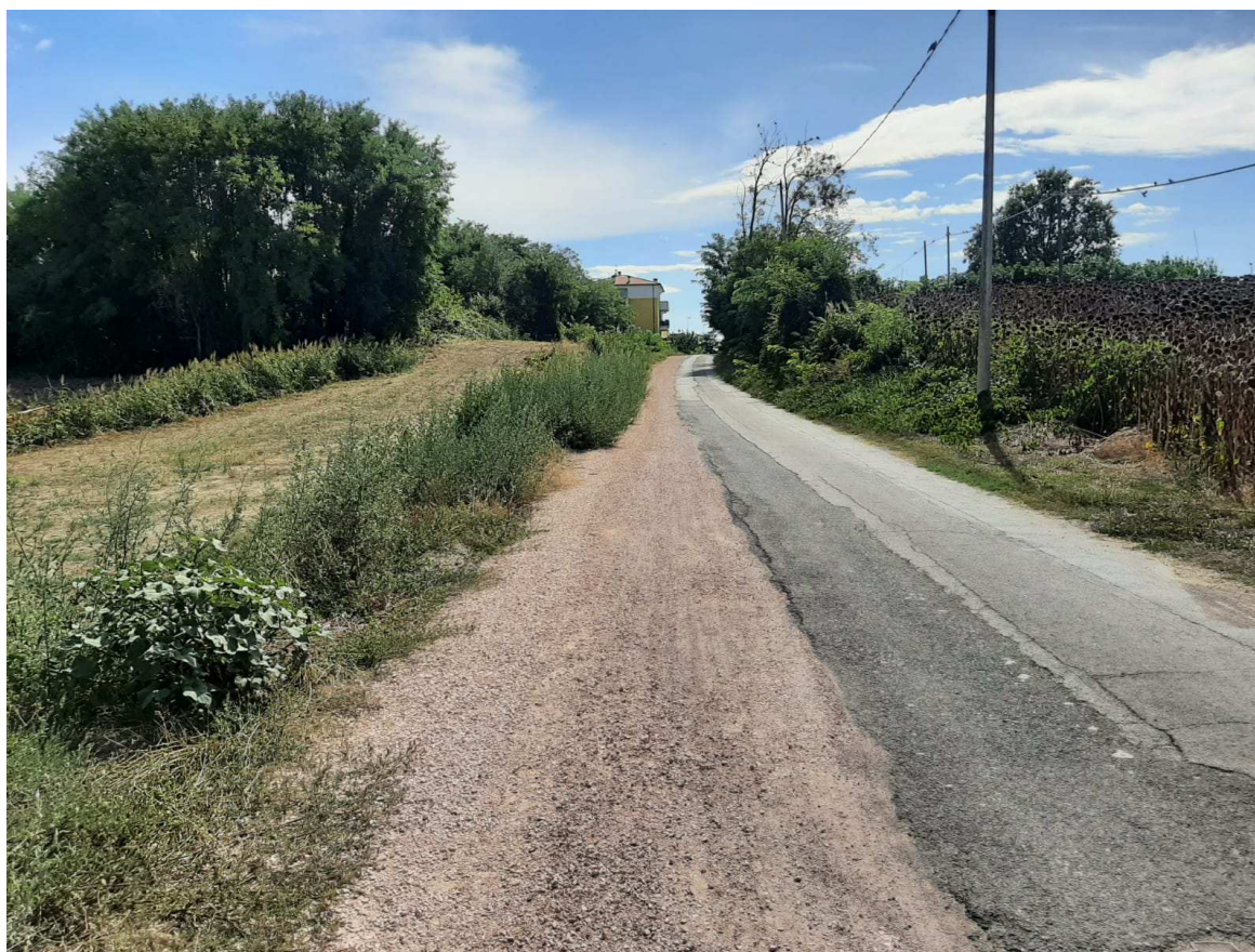
Direzione mare – monte – Foto 2 in prossimità della sezione 11 individuata sull'elaborato grafico TAV. N.3