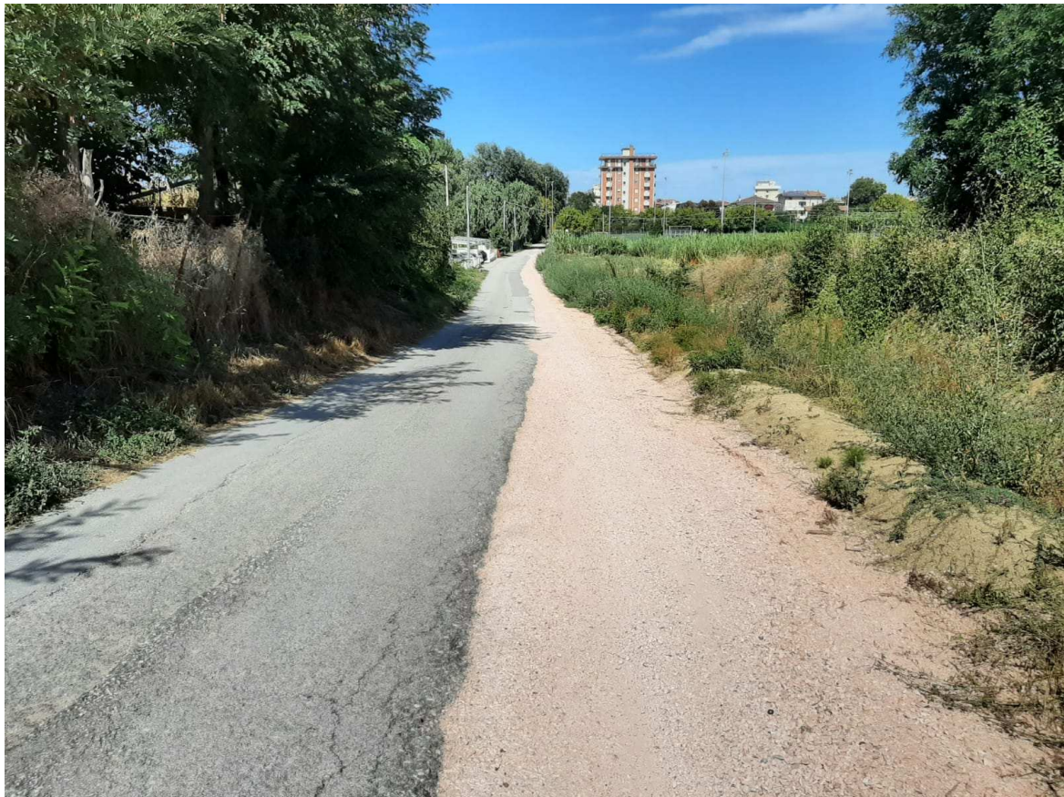
Direzione monte – mare – Foto 6 in prossimità della sezione 7 individuata sull'elaborato grafico TAV. N.3