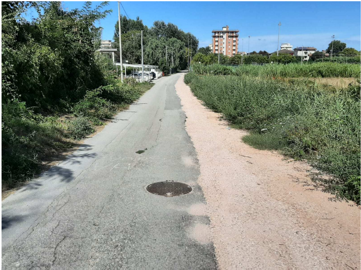
Direzione monte – mare – Foto 7 in prossimità della sezione 12 individuata sull'elaborato grafico TAV. N.3