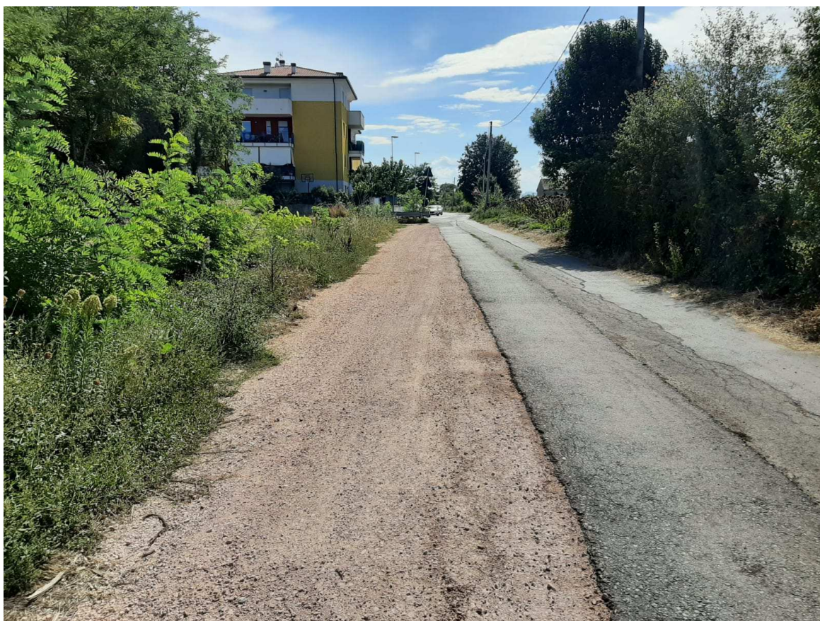
Direzione mare – monte – Foto 4 in prossimità della sezione 4 individuata sull'elaborato grafico TAV. N.3