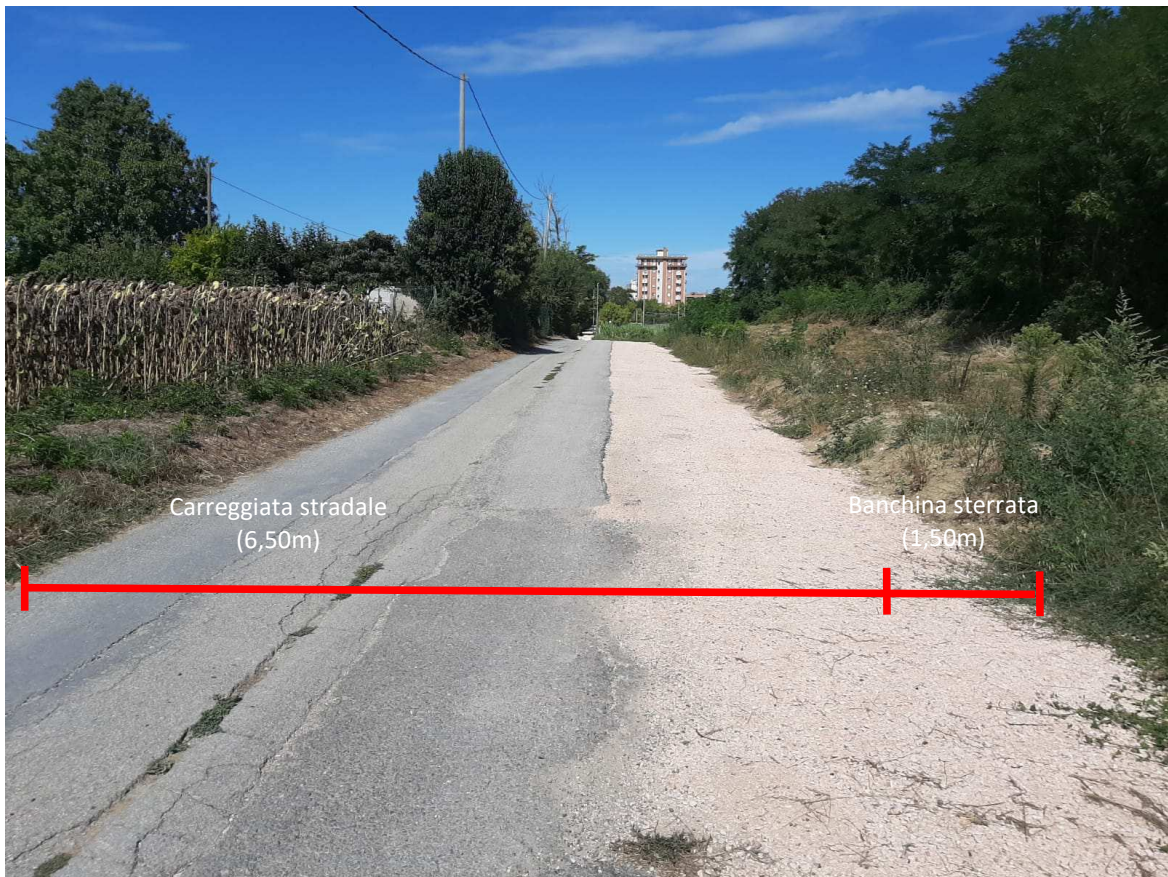
Direzione monte – mare – Foto 5 in prossimità della sezione 5 individuata sull'elaborato grafico TAV. N.3