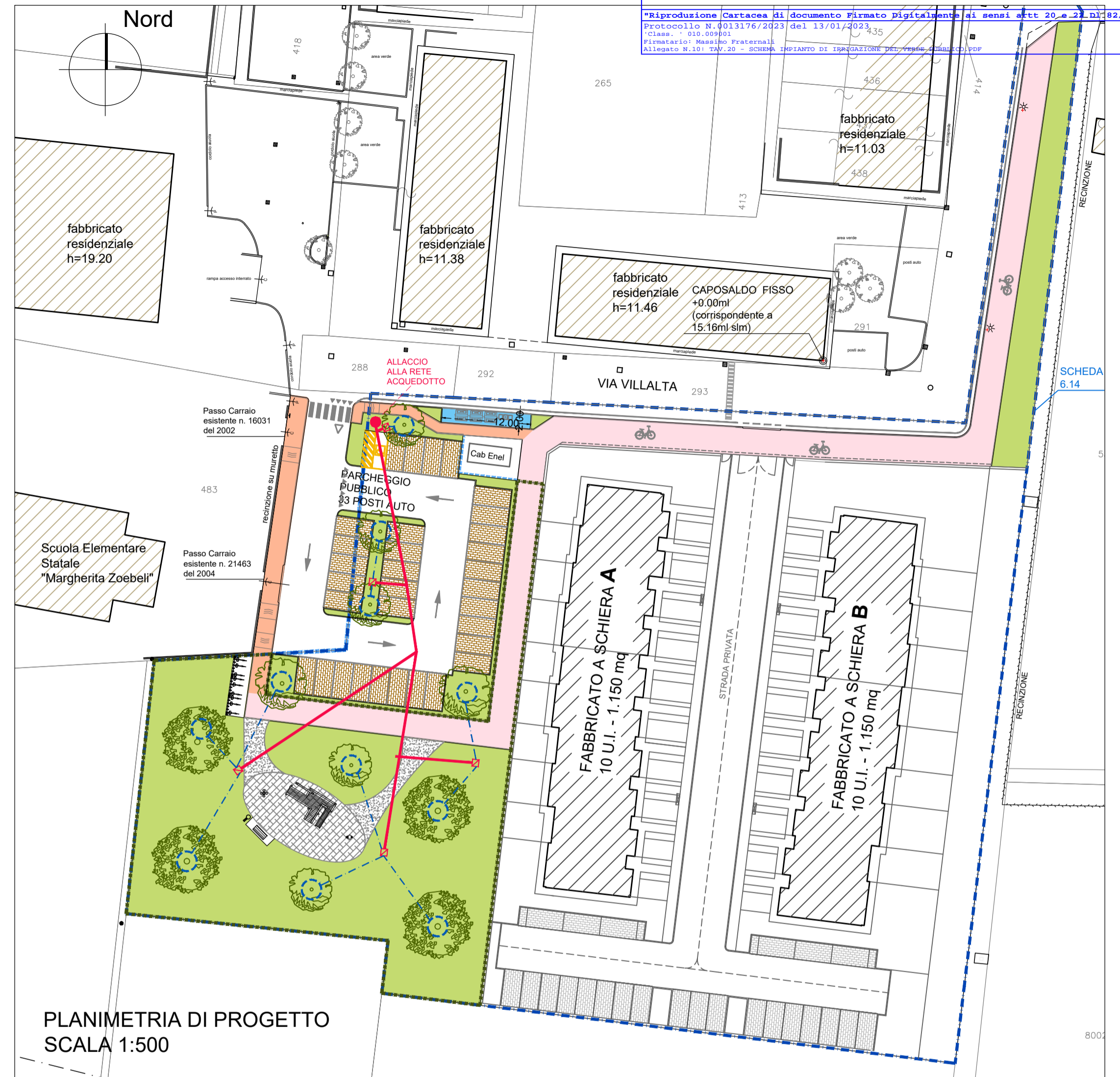
PLANIMETRIA DI PROGETTO SCALA 1:500

COMUNE DI RIMINI *Riproduzione Cartacea di documento Firmato digitalmente ai sensi artt 20 e 21 del D.Lgs. 38/2013 Protocollo N.0013176/2023 del 13/01/2023 Class. : 010.009901 Firmatario: Massimo Fraternali Allegato N.10: TAV_20 - SCHEMA IMPIANTO DI IRRIGAZIONE DEL VERDE PUBBLICO.PDF